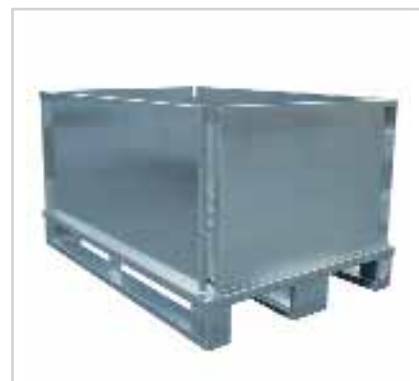
Container à châssis amovible et pliable