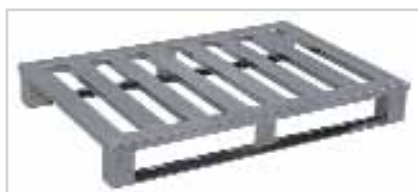
Palette aluminium, le poids lourd, type 512 Plateau ajouré à 6 lames transversales, modèle à semelles lourdes