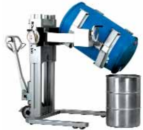
ROBUSTO FL 350 GBK