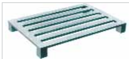
Palette aluminium à 4 entrées type 520 Plateau ajouré à 4 lames longitudinales et 4 pieds d'angle

Fabricant novateur, SCHNEIDER LEICHTBAU offre un assortiment très large de palettes pour tous les champs d'application – toutes disponibles avec la surface AluClean® :