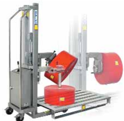
ROBUSTO Reflex 125 V