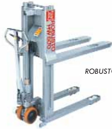
ROBUSTO HHW 600