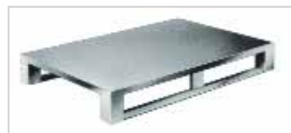
Palette de transport en aluminium, le modèle super hygiénique, type 512 au fermé en haut et en bas, modèle à semelles lourdes