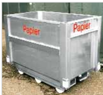
Container sur roulettes