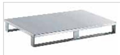
Palette de transport aluminium type 816 Plateau fermé en haut et en bas, avec semelles