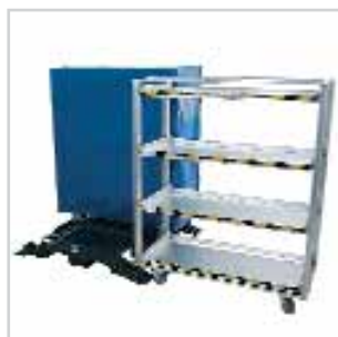
Chariot de transport variable