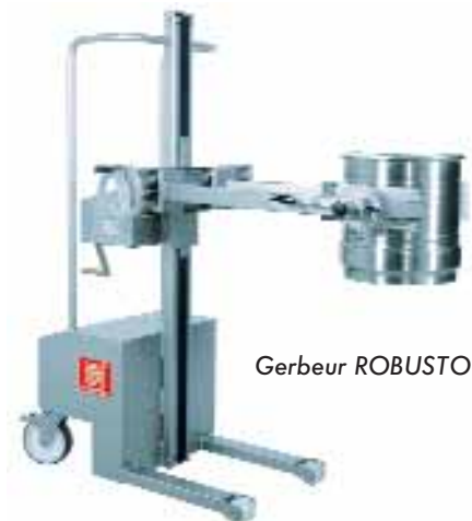
Gerbeur ROBUSTO FL 70 GBK