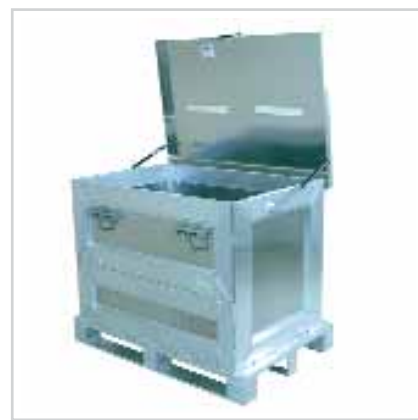
Containers à déchets