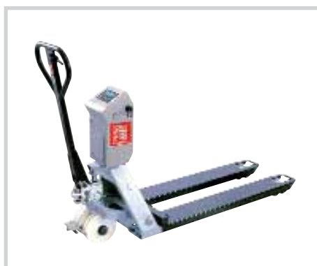
ROBUSTO Prima SL 1000 / VL 1000

Veuillez trouver les détails de tous nos modèles disponibles dans notre plaquette spéciale. Demandez-nous notre plaquette « Systèmes de pesage mobile » !