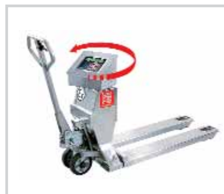
ROBUSTO SL 3000 Ex / VL 3000 Ex