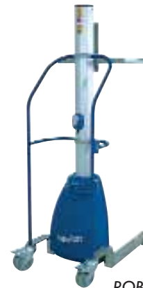
ROBUSTO Newton 250