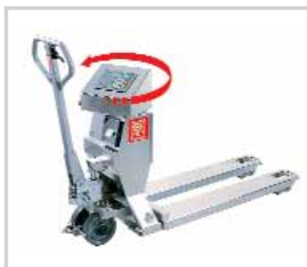
ROBUSTO SL 3000 / VL 3000