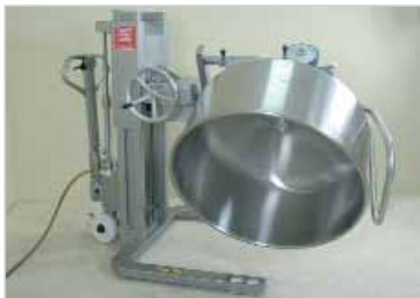
Gerbeur pneumatique à basculement latéral, système de préhension à 2 broches