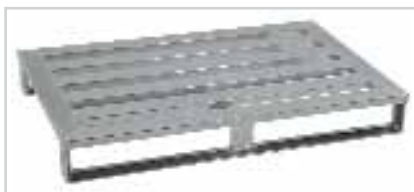
Palette aluminium type 816R Plateau ajouré à 4 lames longitudinales, modèle à semelle légère