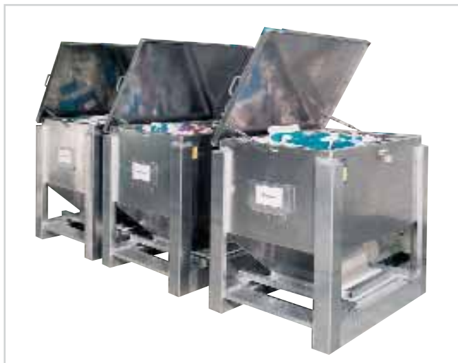
Containers à formes sèches