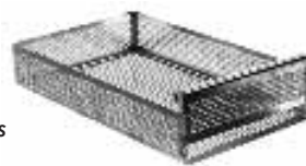
Caissette d'ampoules avec coulisse