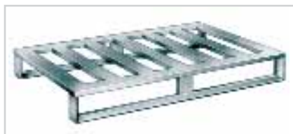
Palette aluminium – le modèle classique, type 816 Plateau ajouré à 5 lames transversales, modèle à semelle légère