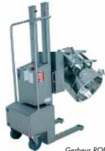
Gerbeur ROBUSTO FL 120