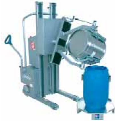
Gerbeur ROBUSTO FL 120 E D GBK