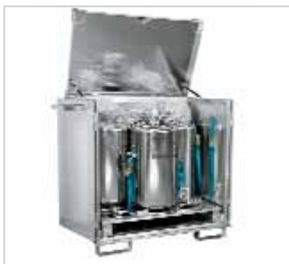
Container à semelle courte