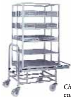
Chariot roulant avec convoyeur à rouleaux

Indépendamment de la forme et de la géométrie des pièces, l'ingénierie SCHNEIDER développe les porte-pièces idéaux pour votre processus de stérilisation.