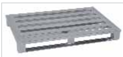
Palette aluminium, le poids lourd, type 512R Plateau ajouré à 4 lames longitudinales, modèle à semelles lourdes