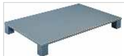
Palette de transport aluminium type 520 Plateau fermé en haut et en bas, avec 4 pieds d'angle