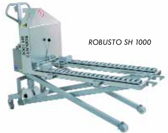
ROBUSTO SH 1000