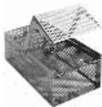
Caissette d'ampoules avec clapet