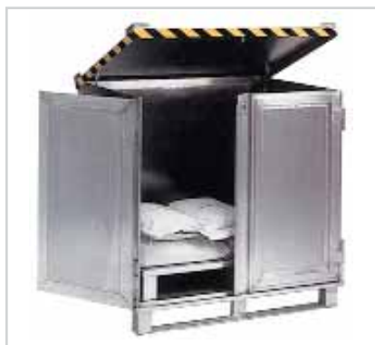
Petit container à semelles longitudinales