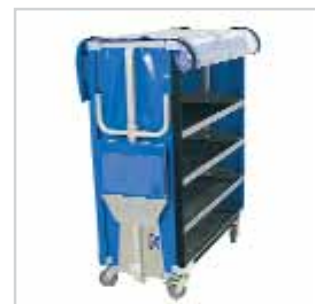
Chariot à étagères