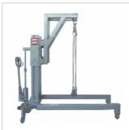
Transpalette à potence, type grue