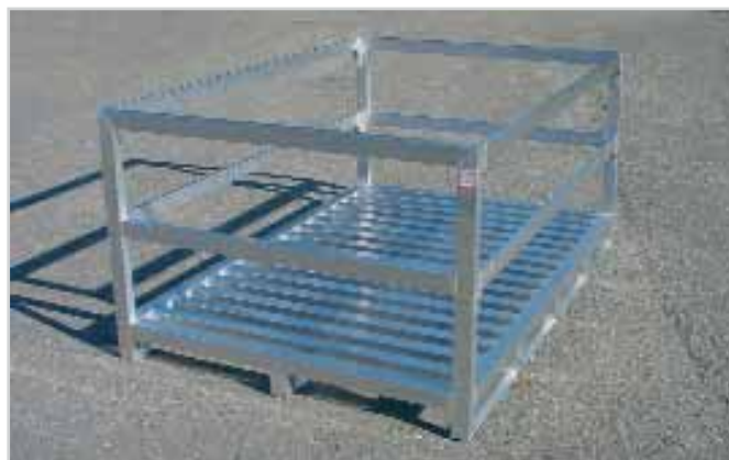
Box aluminium à semelles longitudinales