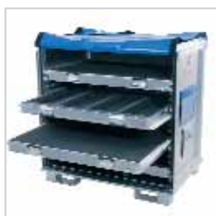
Container à bâche GK22