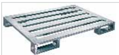
Palette aluminium à semelle courte Plateau ajouré à 4 lames longitudinales et 4 semelles courtes de 300 mm de long